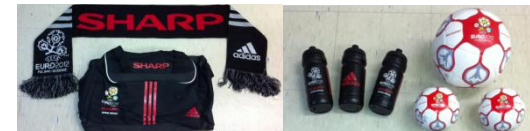
どれが当たる運次第です!