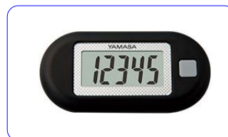
YAMASA ポケット万歩 EX-150

※その他のウォーキング歩数計を使用する場合はご自身でご準備ください。高機能活動量計や歩数計機能付きスマートフォン、100円均一ショップの歩数計など、ご自身にあった歩数計をお使いください。